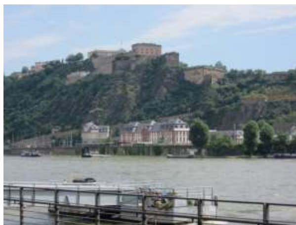
Le Fort Ehrenbreitstein