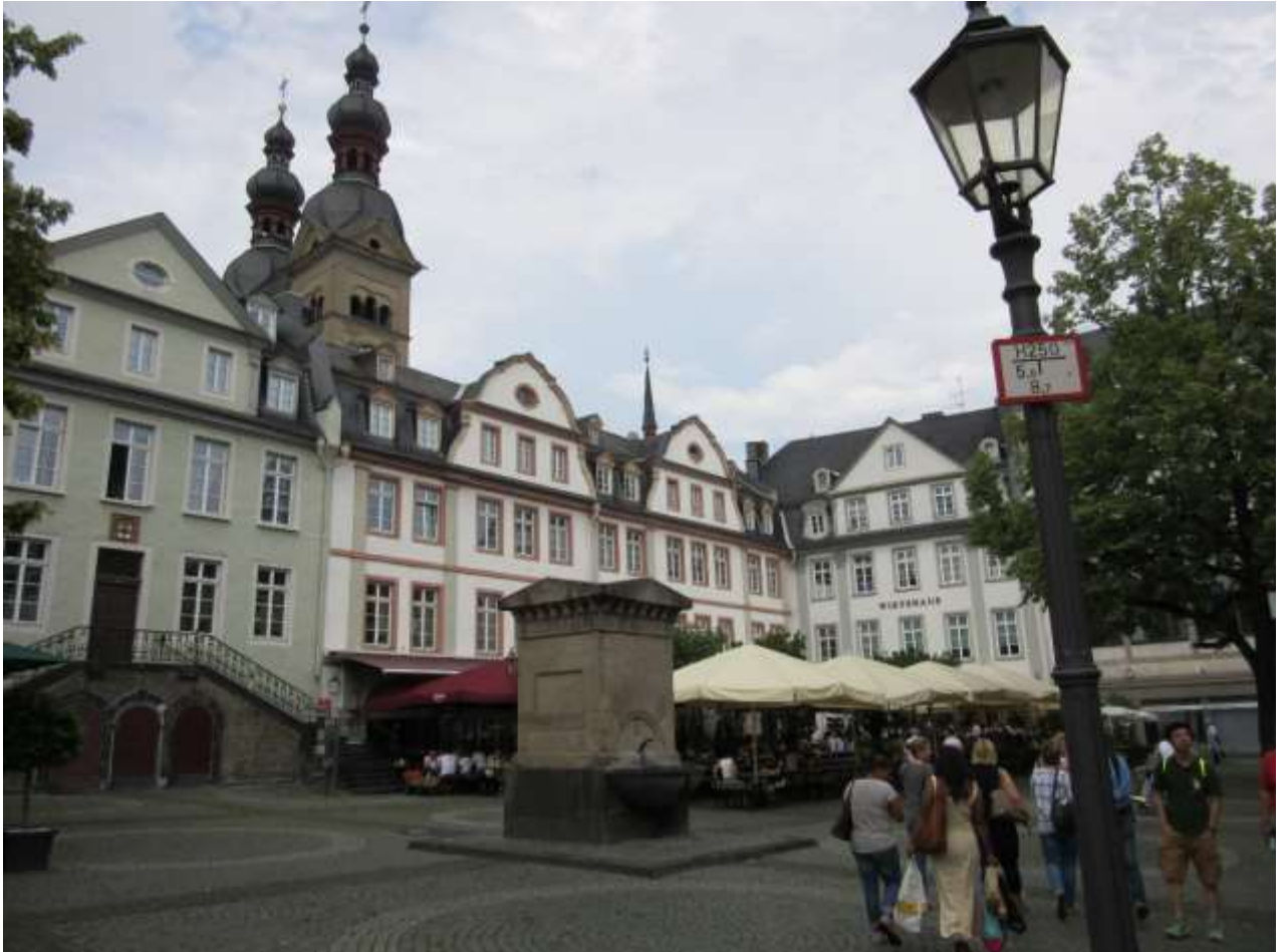
Koblenz - Am Plan, nahe der Liebfrauenkirche

17:00 Uhr Rückfahrt nach Rodgau (Eintreffen am Bürgerhaus Nieder-Roden bei normalen Verkehrsverhältnissen gegen 18:30 Uhr).