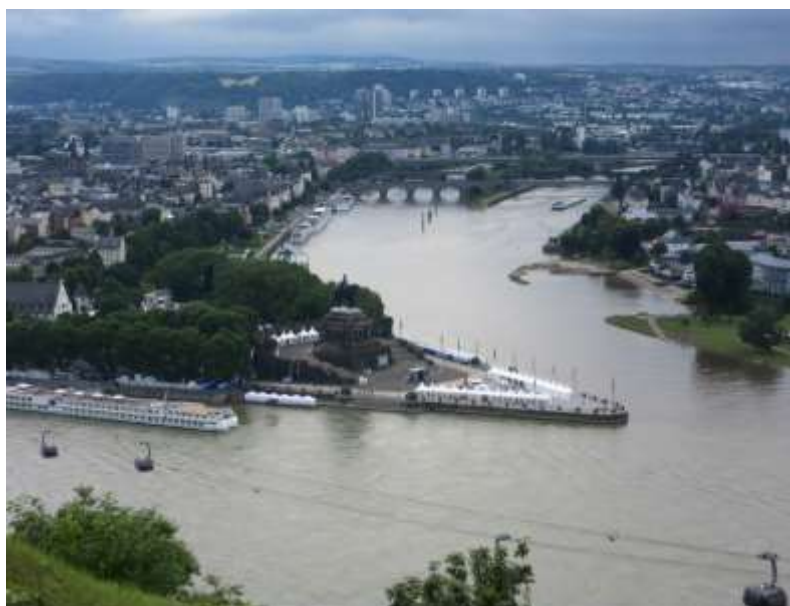
Blick vom Ehrenbreitstein auf die Moselmündung